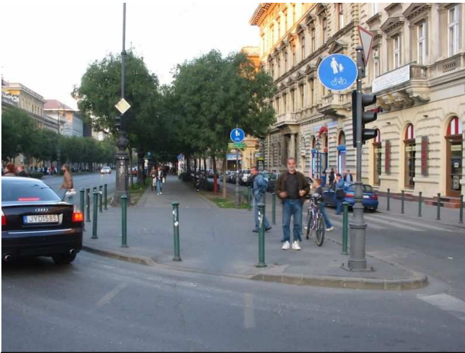
Gyalog- és kerékpárút kezdete az Andrassy úton, kelet felé

A szervízúton haladva a KRESZ szabályai szerint a kerékpárosok lemondanak a keresztező utcáknál az elsőbbségükről. Még így is egyenletesebben és biztonságosabban lehet kerékpárral haladni, mint a gyalogosok között. A forgalombiztonságot forgalomtechnikai beavatkozásokkal lehet növelni (jelzőlámpák kerékpáros számára szabad jelzés biztosítása, míg gépkocsik számára tiltás van).