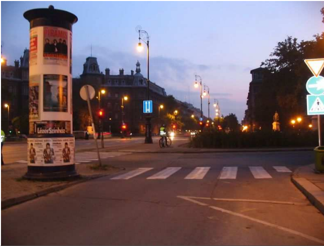
Szerviz útról felhajtás a Köröndre, nyugat felé

A szerviz út a körönd után is folytatódik. A kerékpárosok azonban nem fognak a körpályán haladni. Ezért javasoljuk a köröndön keresztül, a gyalogosjárdával párhuzamosan, a buszmegálló mögött, (a jelenlegi gyalogjárda és zöldfelület rovására) önálló (gyalogosoktól elválasztott - de nem sárga csíkkal) minimum 2,20 m széles kerékpárutat létesíteni.