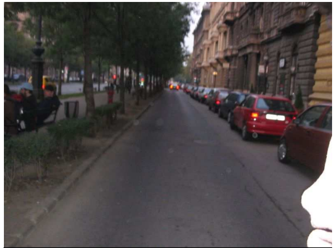
Szervízút az Andrassy út mentén, kelet felé