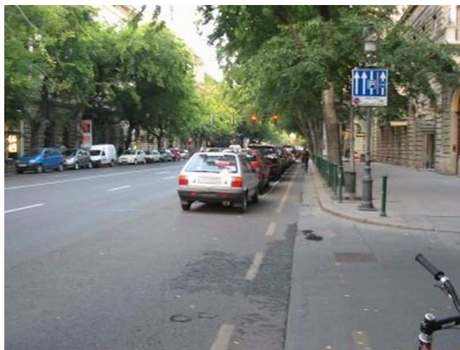
Kerékpársáv kezdete az Andrassy úton , kelet felé

A kerékpárosok jelenleg a parkoló autósor jobb oldalán haladhatnak. A legnagyobb probléma, hogy a ráparkolások, ajtónyitások miatt sokszor ellehetetlenül a kerékpárosok továbbhaladása. A jobbra kanyarodó autósok nem látják jól a kerékpársávon haladókat.