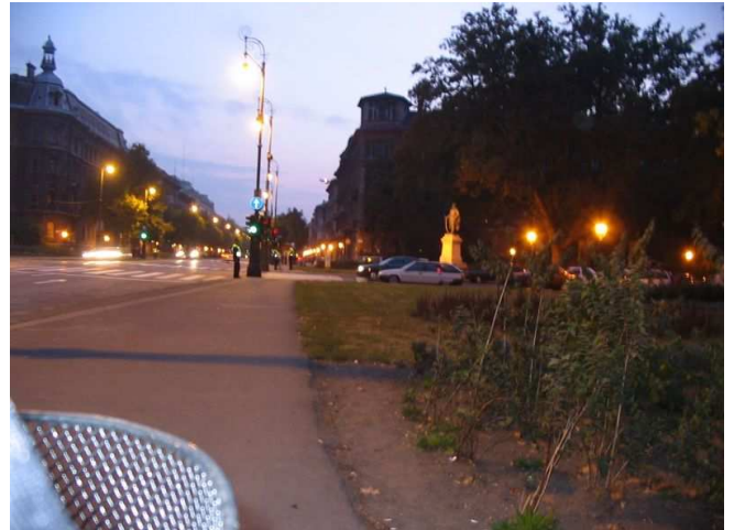
Járda Köröndön, nyugat felé

A kialakítás érzékeny pontja a szerviz útról a kerékpárútra és onnan vissza a szervizútra való átvezetés forgalomtechnikai kialakítása.